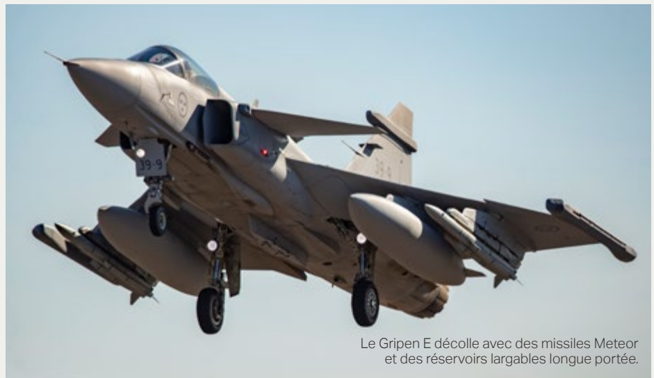
Le Gripen E décolle avec des missiles Meteor et des réservoirs largables longue portée.