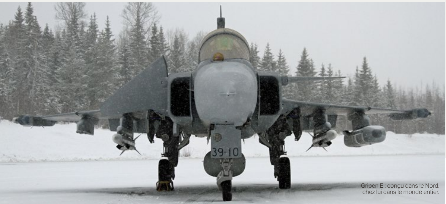
Gripen E : conçu dans le Nord, chez lui dans le monde entier.

l'une des années où l'OTAN a réalisé le plus grand nombre de décollages immédiats. Plus de 400 heures de vol et 370 décollages ont été effectués par les équipages hongrois de Gripen. Le Gripen a également participé à l'opération Protecteur unifié de l'OTAN, dans le cadre de laquelle les Gripen de la force aérienne suédoise ont effectué des missions de reconnaissance tactique au-dessus du territoire libyen. Le premier aéronef est arrivé le 2 avril 2011, seulement 23 heures après que le Parlement suédois ait autorisé l'appareil à se rendre sur le continent africain et à prendre part à l'opération dirigée par l'OTAN. Le déploiement comptait huit Gripen et à la fin de la mission, le 24 octobre 2011, 650 missions de combat et deux mille heures de vol avaient été effectuées et 150 000 photos de reconnaissance avaient été produites.