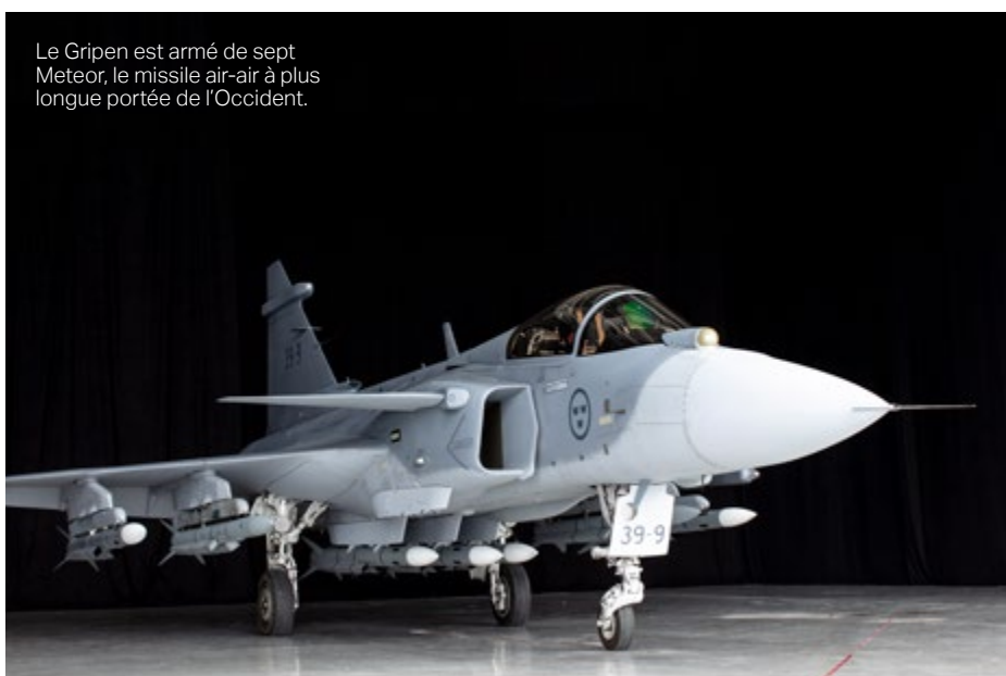
Le Gripen est armé de sept Meteor, le missile air-air à plus longue portée de l'Occident.

La GE peut également brouiller, attirer, tromper et envahir les capteurs radar et les missiles ennemis, créant ainsi une forme électronique de furtivité qui ne se dégrade pas, mais est prête à évoluer.