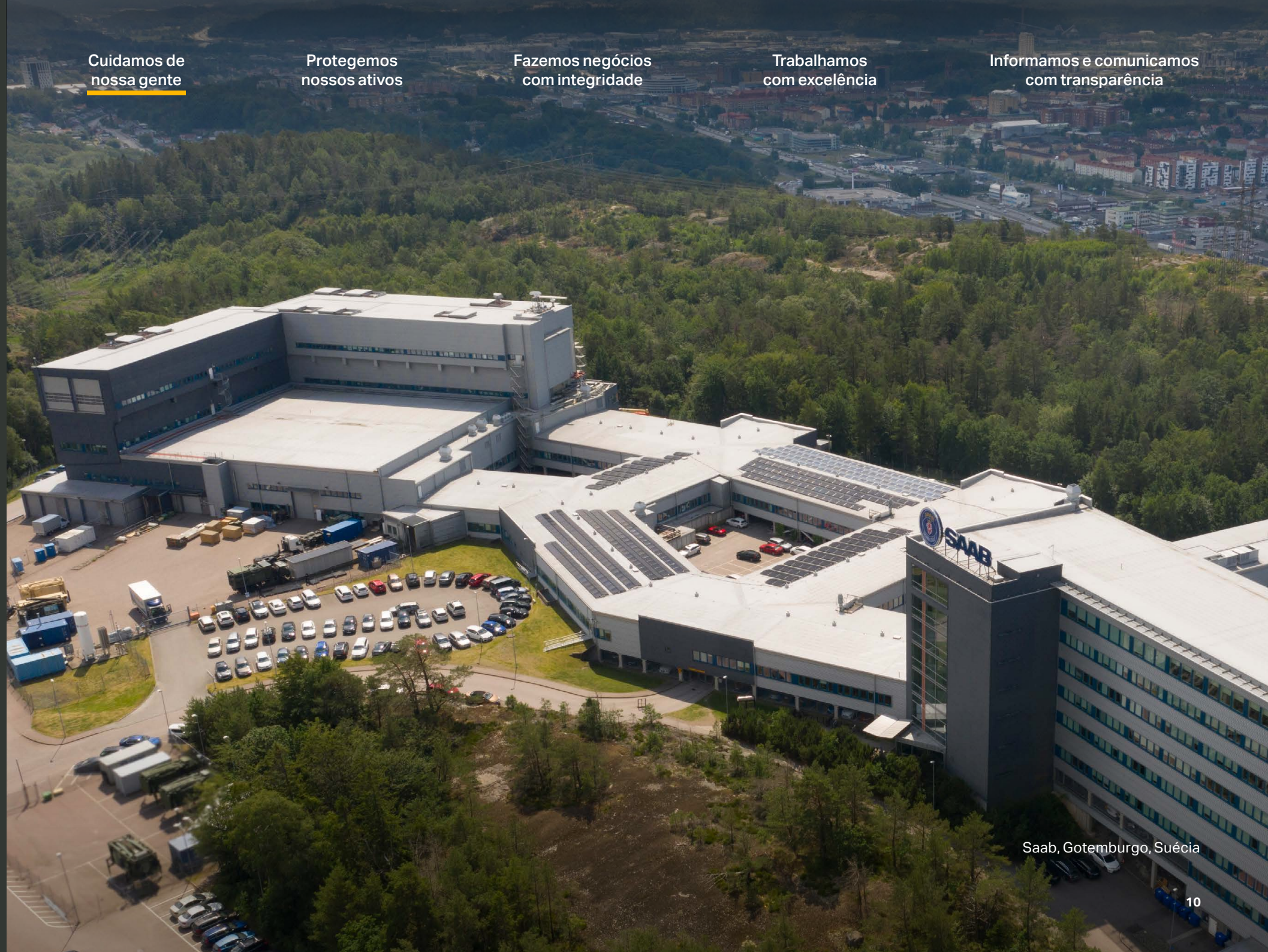
Saab, Gotemburgo, Suécia

Informamos e comunicamos com transparência