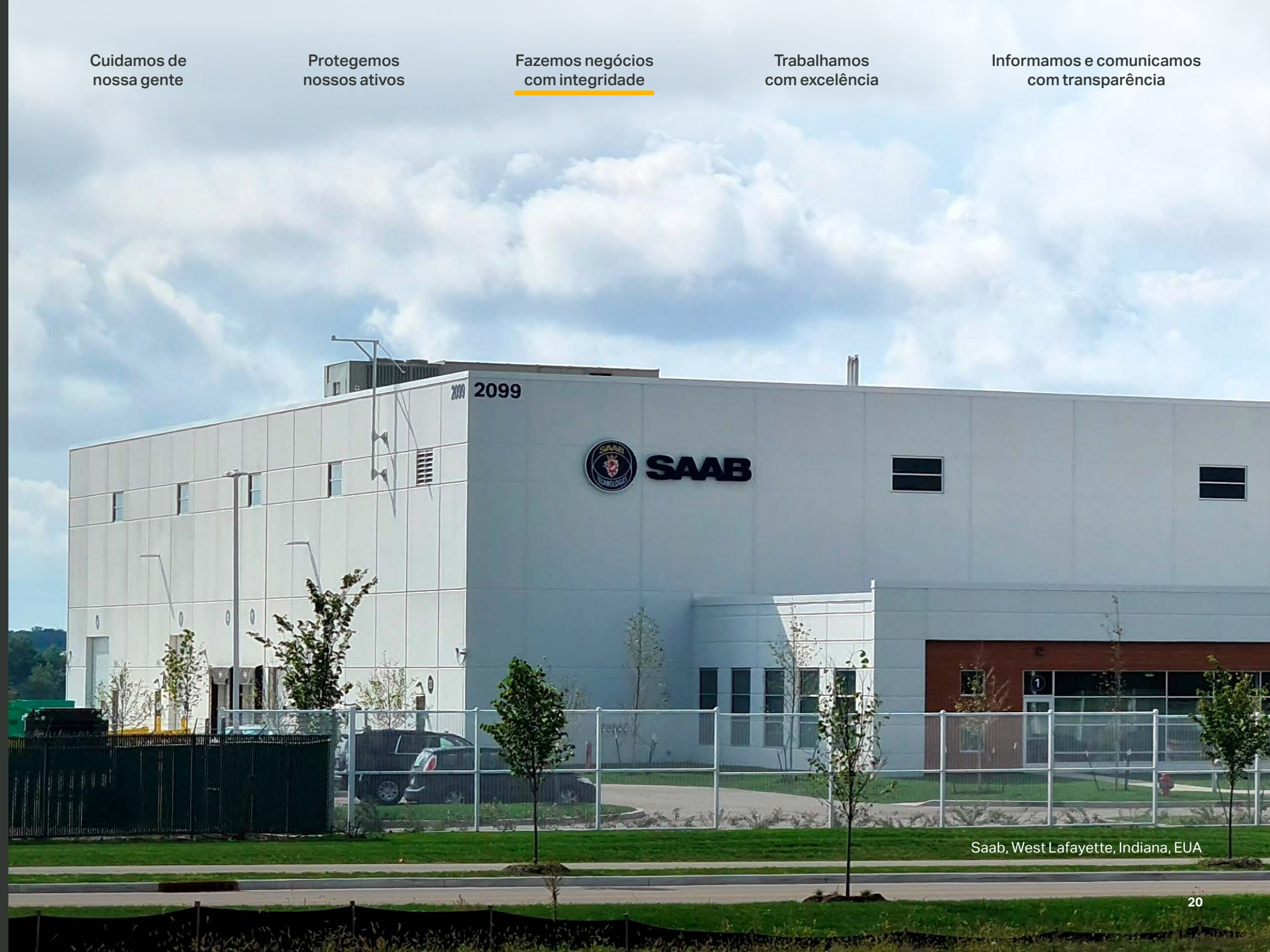
Saab, West Lafayette, Indiana, EUA