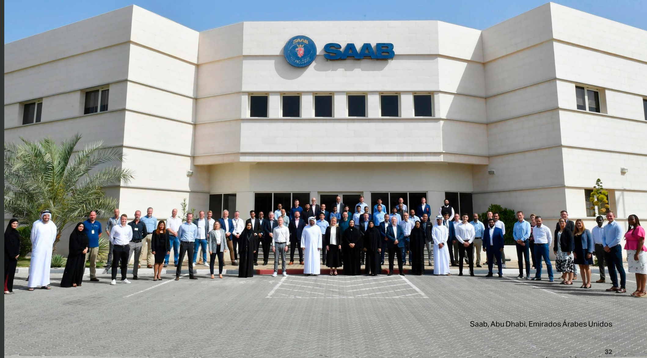
Saab, Abu Dhabi, Emirados Árabes Unidos