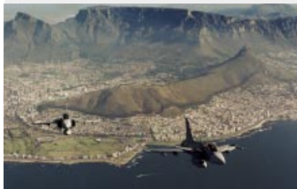
Gripen över Kapstaden.

MILITARY AEROSPACE består bl.a. av affärsenheterna Gripen , Dynamics och Avionics . Saab tillverkar Gripen, världens enda fjärde generationens stridsflygsystem i operativ tjänst. För marknadsföring på exportmarknaderna driver Saab ett joint venture med British Aerospace. Dynamics är verksamt inom områdena styrda vapen och optroniska system. Avionics , som ägs gemensamt med Ericsson, utvecklar och tillverkar system för telekrig, display- och spaningsystem framförallt till Gripen.