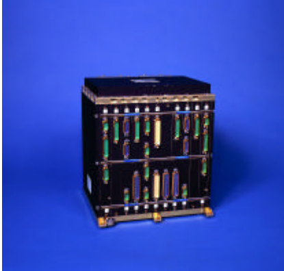
Centraldatorn i systemet, CDMU