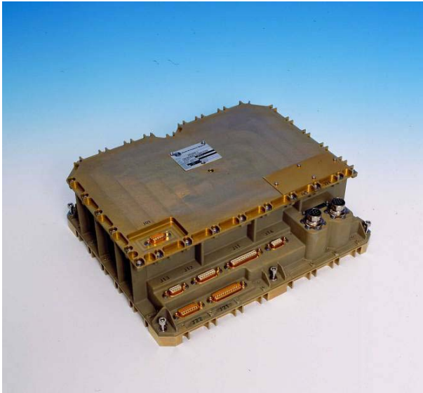
Two such units work in parallel during the launch of Ariane-5 to ensure that no errors occur.