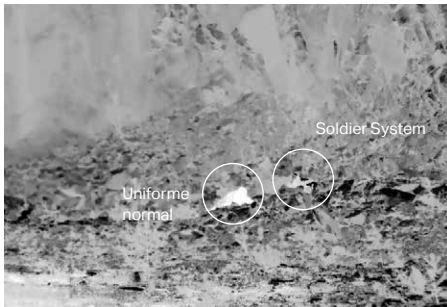
Imagem térmica, distância 50m