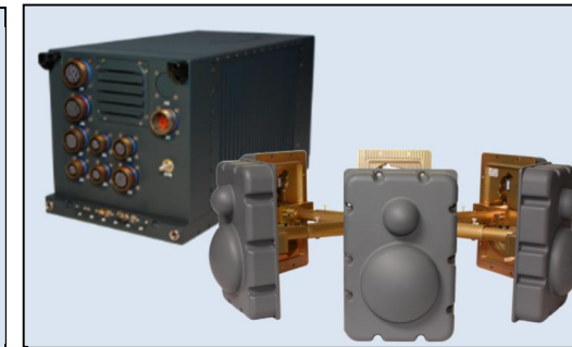
Sistema SME-150: Antena DF Compacta o Envoltorio de Mástil alrededor de la Antena y EWC-150