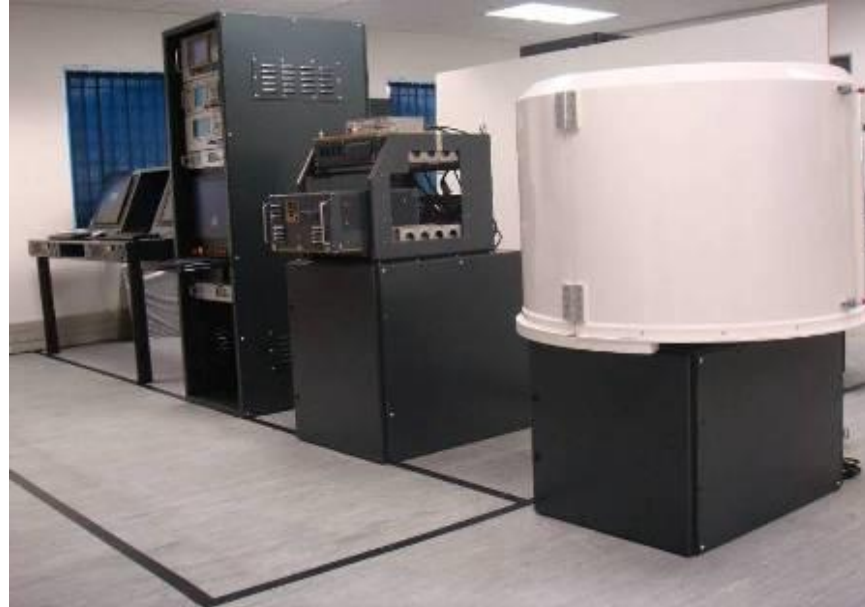
Banca de Pruebas Integrada (ITB)

ITB ofrece la funcionalidad necesaria para emular señales de radar y medir el sistema ESM bajo prueba, evalúa las interfaces del sistema en prueba, detecta la búsqueda de fallas asistidas por la banca de pruebas y genera reportes en respuesta a los resultados de la prueba.