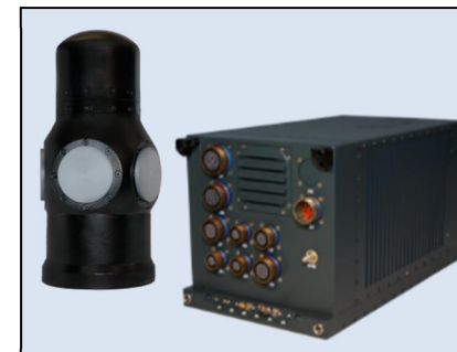
Sistema SME-50: Antena DF Compacta y EWC-50