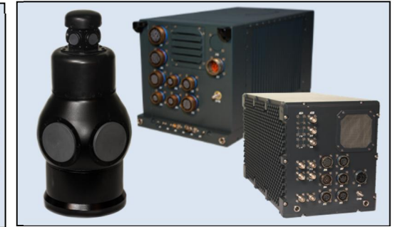
Sistema SME-250: Antena DF Compacta - 250, EWC-150 y DRx