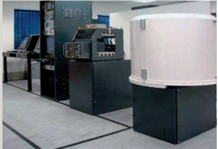
Banco de pruebas integrado (ITB)

El ITB proporciona la capacidad de realizar pruebas de sistemas y LRU en tierra en un entorno controlado. Se suministra una capacidad completa de diagnóstico y verificación del sistema.